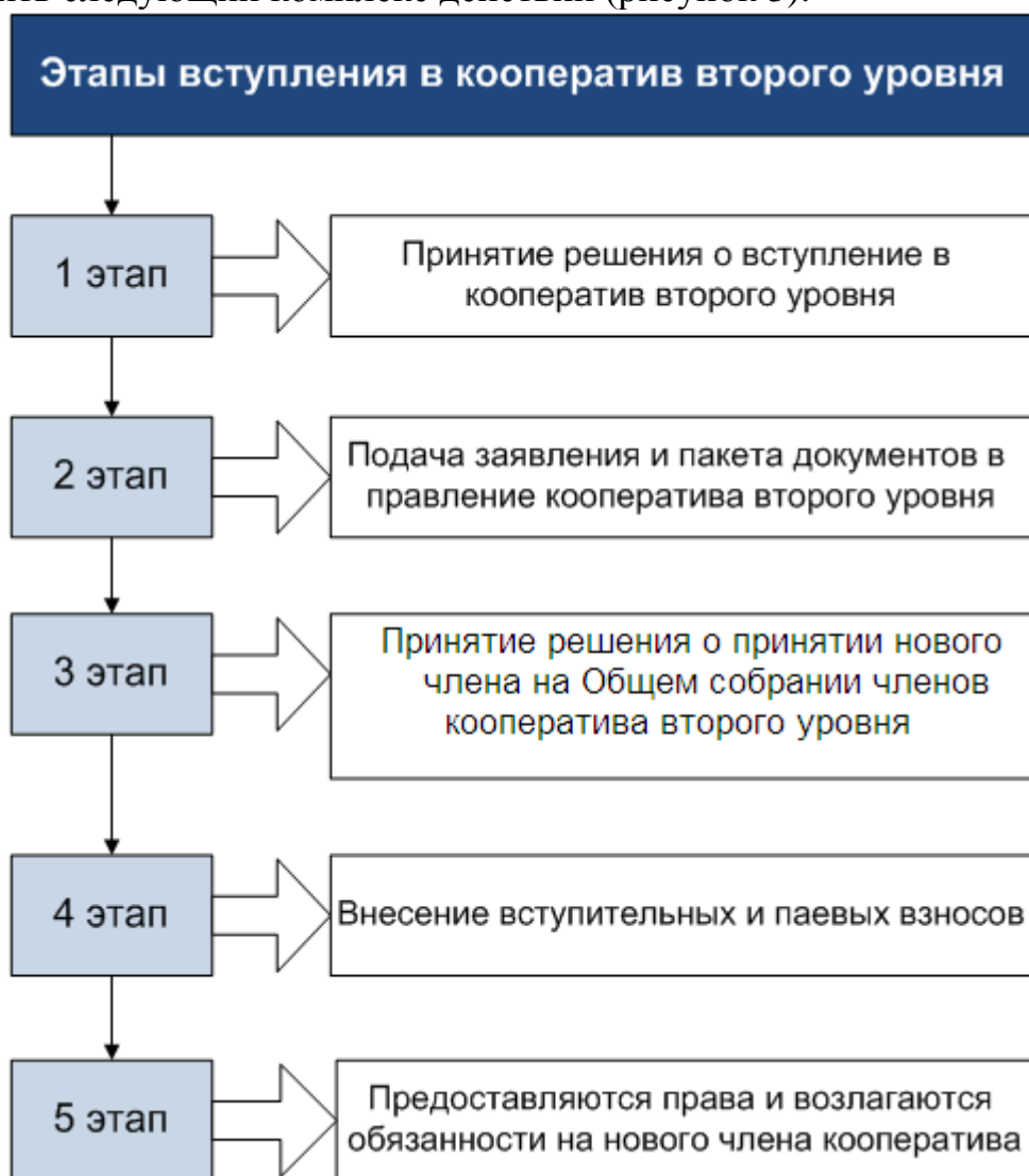
Рисунок 3. Этапы вступления в кооператив второго уровня

Для вступления в кооператив второго уровня необходимо осуществить следующий комплекс действий (рисунок 3).