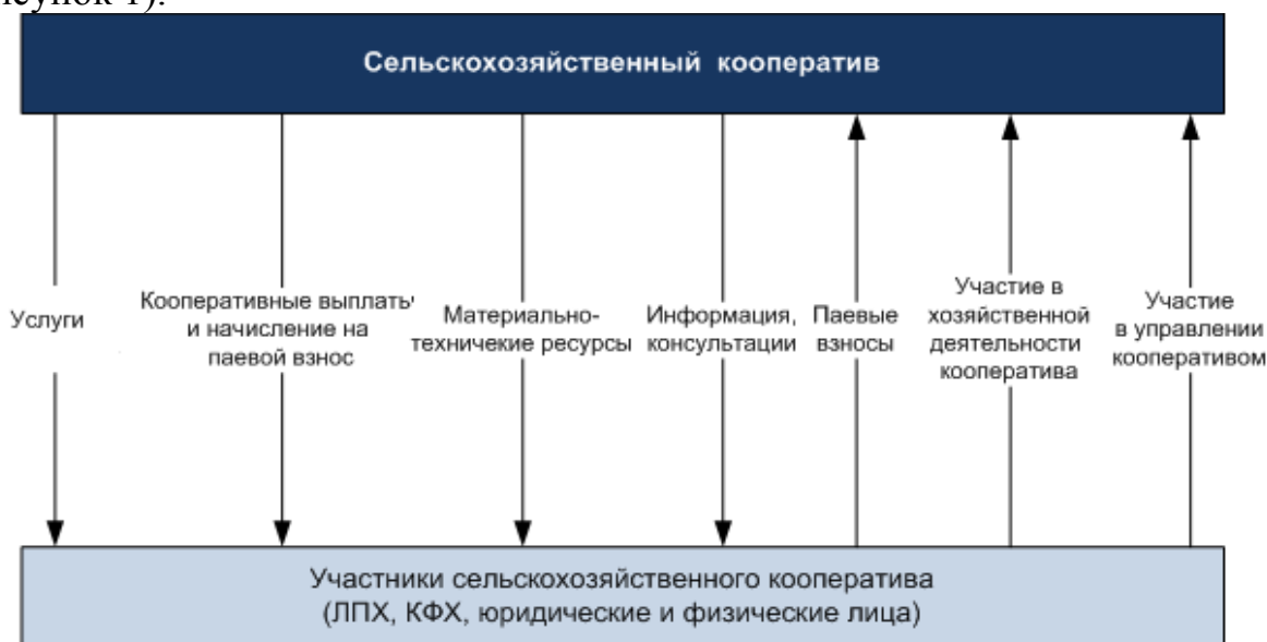
Рисунок 1. Схема взаимодействия сельскохозяйственного потребительского кооператива с его членами

Взаимодействие сельскохозяйственного потребительского кооператива с его участниками можно представить на следующей схеме (рисунок 1).