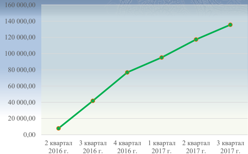
Динамика выручки от продаж молочной продукции ТМ "Резной Палисад", тыс.руб.